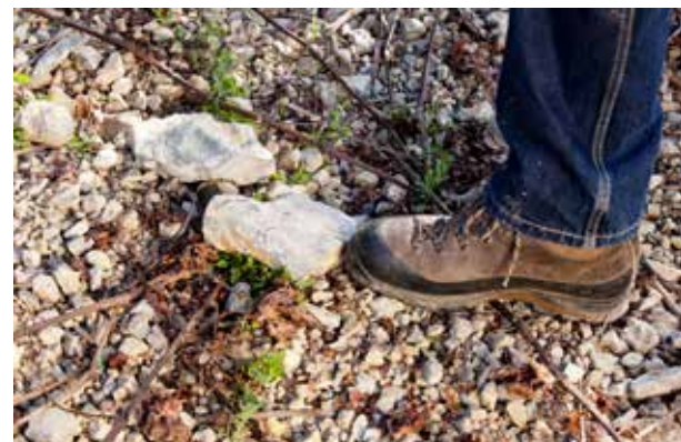
Alle Rebstöcke unserer klassischen Lagenweine wachsen auf Wellenkalkterroir.

Riesling trocken 13,33 €/l 0,75 l 10,00 € 2022 | Homburger Edelfrau | Qualitätswein SILBER Aroma vom grünen Apfel & Zitrusnoten, mineralische Struktur RZ: 5,3 g/l, GS: 6,5 g/l, A: 12,5 %vol